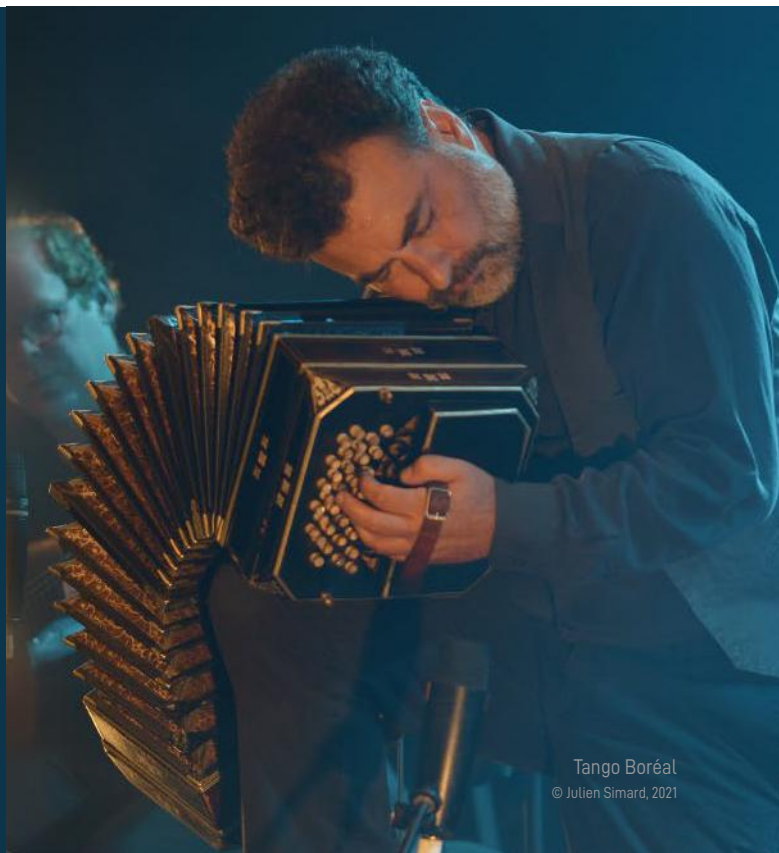
Tango Boréal