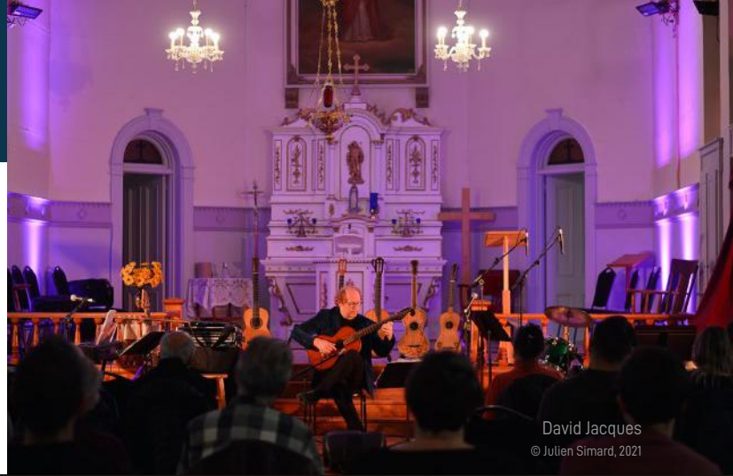
David Jacques © Julien Simard, 2021

La 3 e édition de la Dégelée! qui était initialement prévue en mars 2020, s'est tenue en novembre 2021. 6 concerts ont été réalisés en partenariat avec la Corporation des Arts et de la Culture de L'Islet dans autant de municipalités. Près de 200 spectateurs se sont déplacés pour les concerts, présentant des artistes talentueux d'horizons divers.