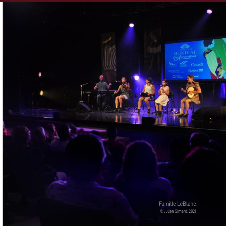
Famille LeBlanc