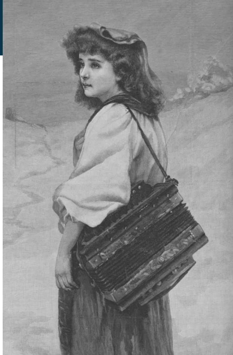
© Collection Musée de l'accordéon, 2021