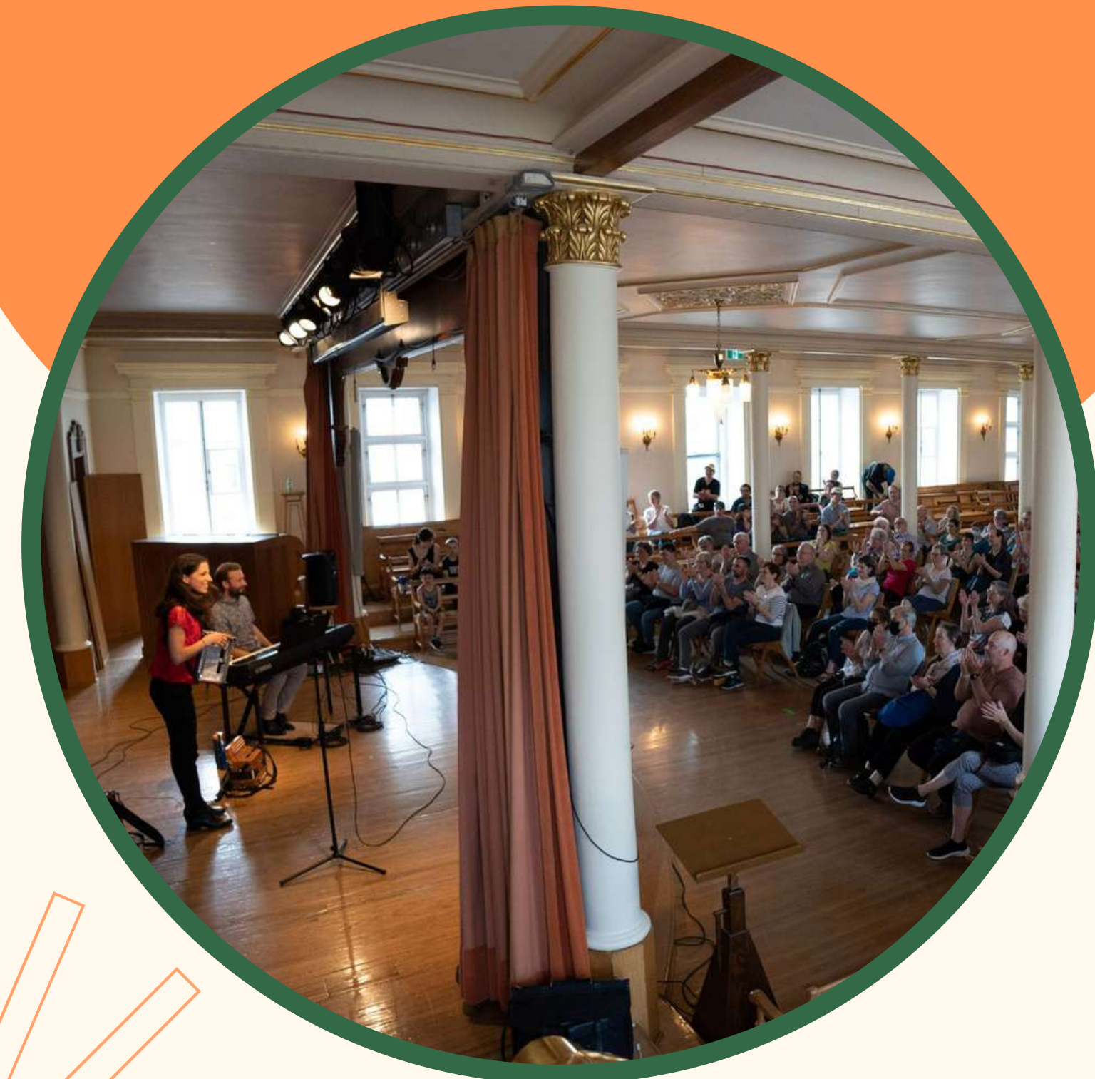
Printemps de la musique, Luminance